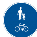
Gemensam gång- och cykelbana