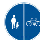
Gång- och cykelbana som är delad med en linje.