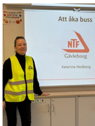
Bussutbildning åk. 2 november 2025 Hemlingborg skola, Gävle