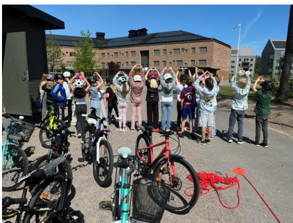
Cykelutbildning åk. 4, juni 2025 Hemlingborg skola, Gävle

Arbeta med konsulttjänster och utbildningar via de av NTF-förbund ägda bolagen Säker Trafik; -Vänerland AB, -Jönköping AB och -Dalarna AB riktade mot kommuner, regioner och företag, anpassade efter det lokala behovet, samt utföra nationella projekt åt Trafikverket.