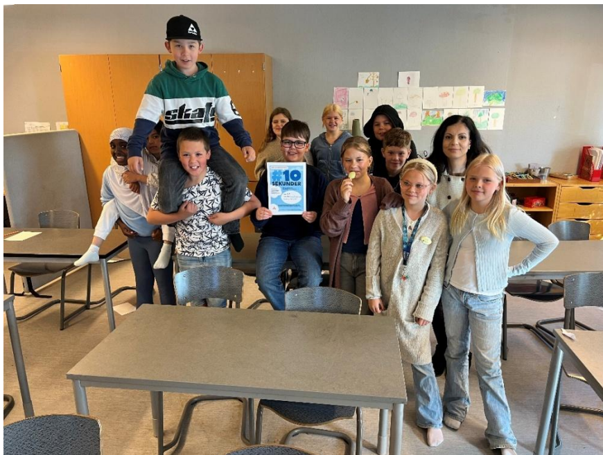
Bergsjö skola klass 4B vann tävlingen ”#10 sekunder”