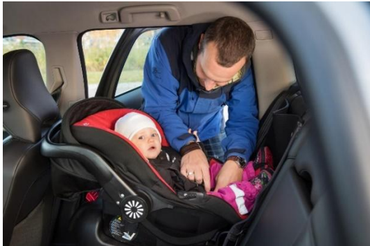
Viktigt att barnen åker bakåtvänt så länge som möjligt.

Under året har personalen informerat personer om allmänna trafikregler, reflexer, cykelhjälmregler, bilbarnstolar mm. Många frågar om bilbarnstolar; hur skall de monteras, när kan jag vända barnet i bilen, skall bilbarnstolen bytas efter krock, kan jag ha en bältestol i framsätet, när kan vi byta till bälteskudde mm?