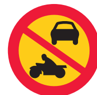
Förbud mot trafik med annat motor drivet fordon än moped klass 2