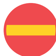
Förbud mot infart med fordon