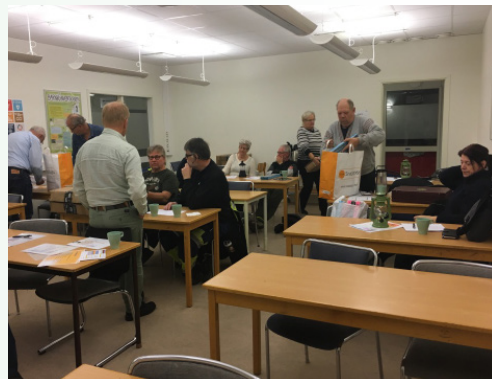
Upptagsmöte för Lyktgubbar ägde 26/10 i Örebro.