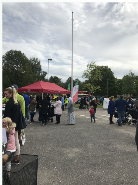
Den 5/9 deltog vi på SOS-dagen i Örebro.