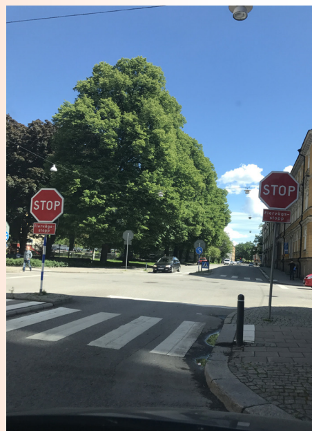
En stoppliktsundersökning har genomförts i Norrköping.