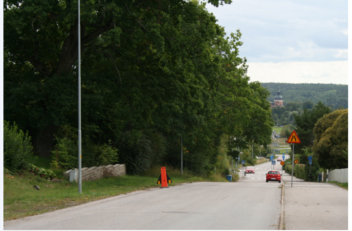
Konceptet "Rätt Fart i Staden" har genomförts i Mariefred i Strängnäs kommun.