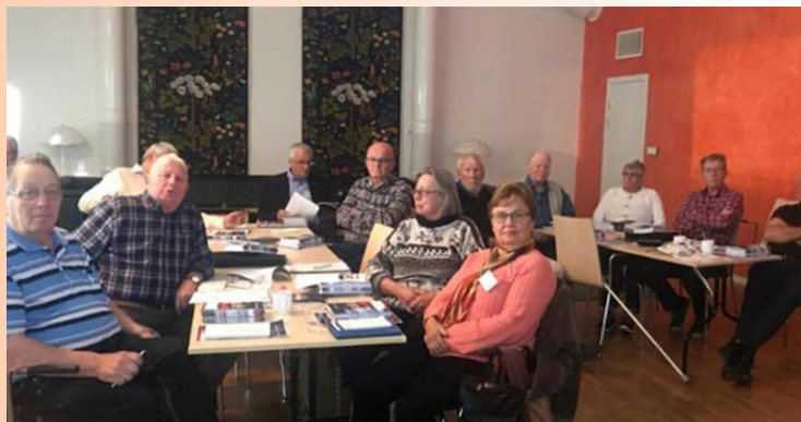
Utbildning av de lokala trafikombuden i Linköping.