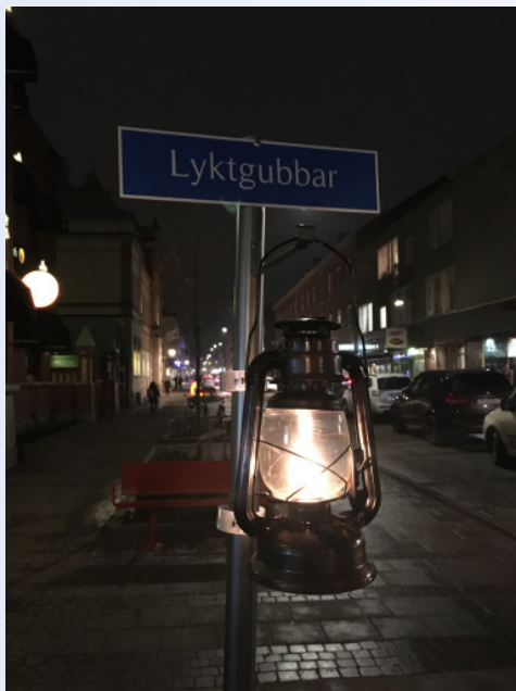
"Lyktgubbar" genomfördes vid två tillfällen i Nyköping under året, i januari samt november.