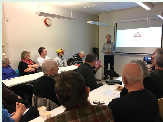
Mätutbildning för medlemsorganisationer hölls i Föreningarnas Hus, Örebro.