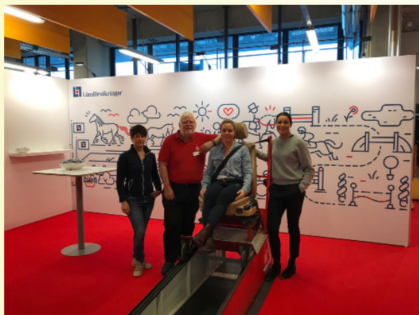
Krocksläden på Friends Arena under "Sweden International Horse Show".