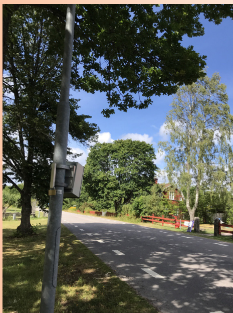
Hastighetsmätningar med SDR-skåp genomfördes under året bl.a. i Malen och Vadstena.