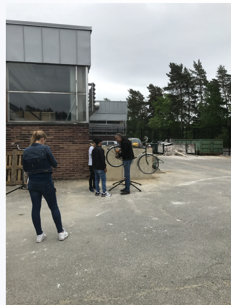
Trafikdag på Rekarneskolan i Eskilstuna.