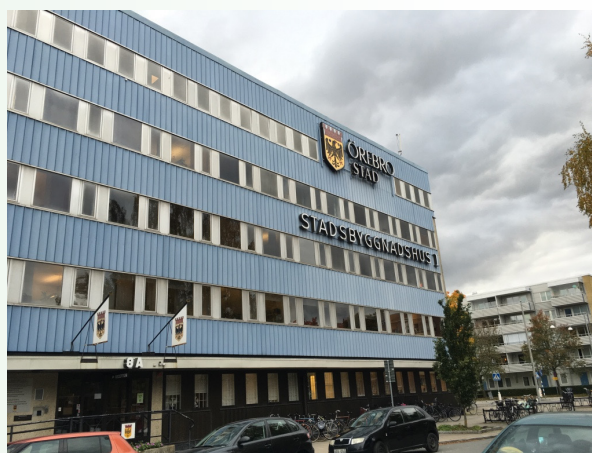
Tre utbildningar har skett för trafikombuden i Örebro kommun.