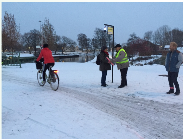
Lyktgubbar 8-9 november i Örebro.