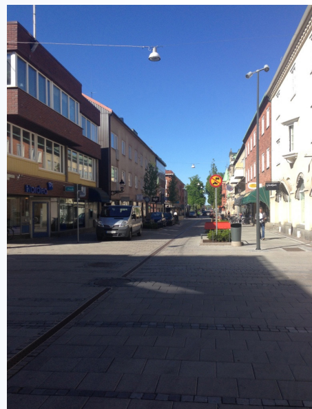
Trafikmätningar har gjorts på Östra Storgatan i Nyköping.