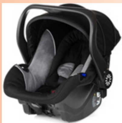
I Östergötland har vi baby-skyddsutyrning i Norrköping samt Linköping. I Norrköping i samarbete med Bilprovningen. I Linköping i samarbete med Körkortscen-ter.