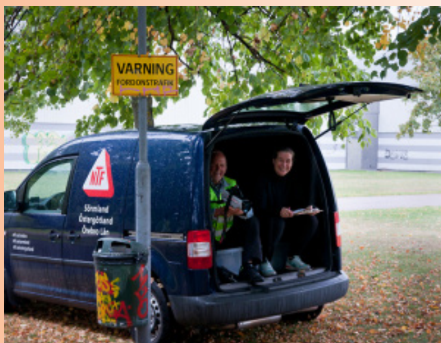
Stångåloppet i Linköping.