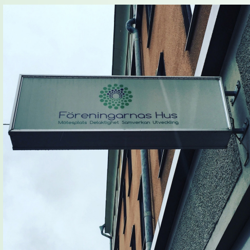
Medlemsmöte i Föreningarnas Hus i Örebro den 8 februari.