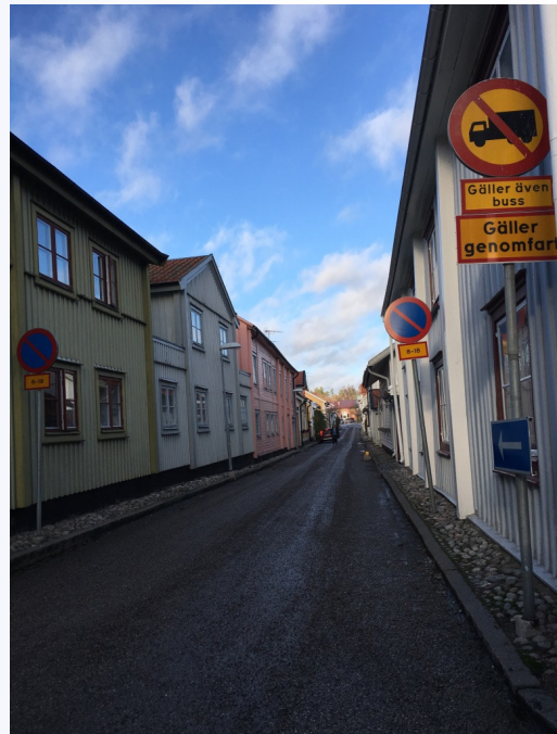
Rätt Fart i Staden i Mariefred.