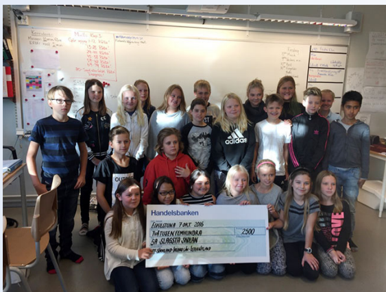
Framtidskampen i Eskilstuna. Klass 5A på Slagsta skolan blev lyckliga vinnare.