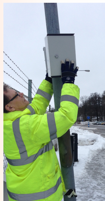
Hastighetsmätning med SDR-skåp har gjorts i bla Ödeshög.