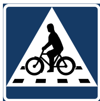
Cykelöverfarten kräver även skylt.