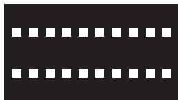
Markering för cykelpassage och cykelöverfart.