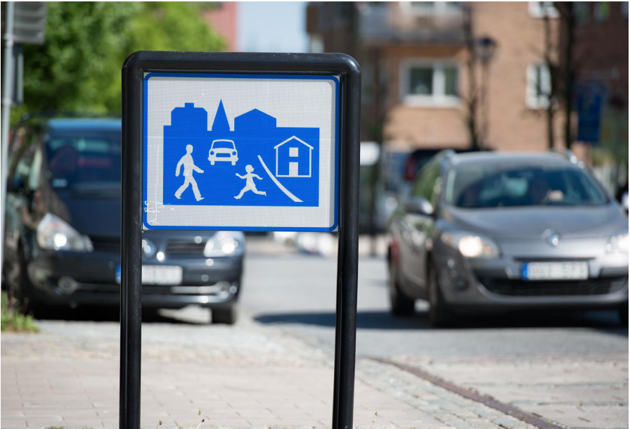
شارع سكني حيوي