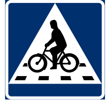
ممرات الدراجات الهوائية تتطلب لافتات أيضًا.